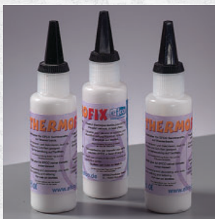
93 189 50 Thermofix Textilkleber