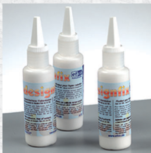
93 735 05 Designfix Folienkleber