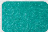
93 210 68 dunkelgrün