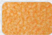
93 210 14 orange