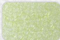
93 210 61 hellgrün