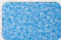
93 210 46 hellblau