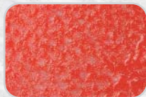
93 210 28 rot