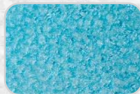
93 210 45 türkis