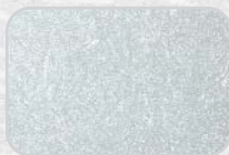
93 210 00 farblos