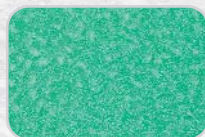
93 210 67 grün