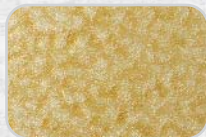
93 210 76 hellbraun