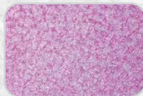
93 210 43 violett