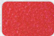
93 210 29 dunkelrot