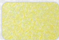
93 210 07 gelb