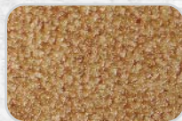
93 210 77 braun