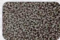
93 210 89 schwarz

Arbeitsanleitung: Nur auf staub- und fettfreie Untergründe auftragen. Kunststoffspitze abschneiden und Cristallicpaint auf eine Malpalette geben. Mit Spongschwamm (93 167 00) aufnehmen. Cristallicpaint auf den gewünschten Untergrund aufputzen. Für stärkere Effekte kann die Farbe nach kurzer Trocknungszeit nochmals aufgetragen werden. Ideal auch zur Verwendung mit selbsthaftenden Stencils. Für