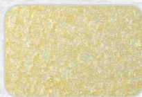
93 210 08 dottergelb